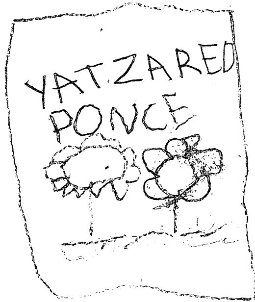
Cuadro con Flores.